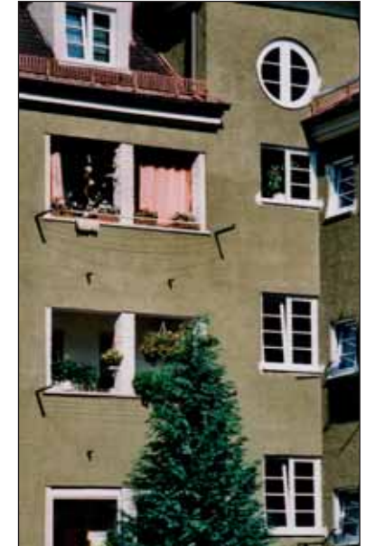
Walpurgisstraße vor der Renovierung