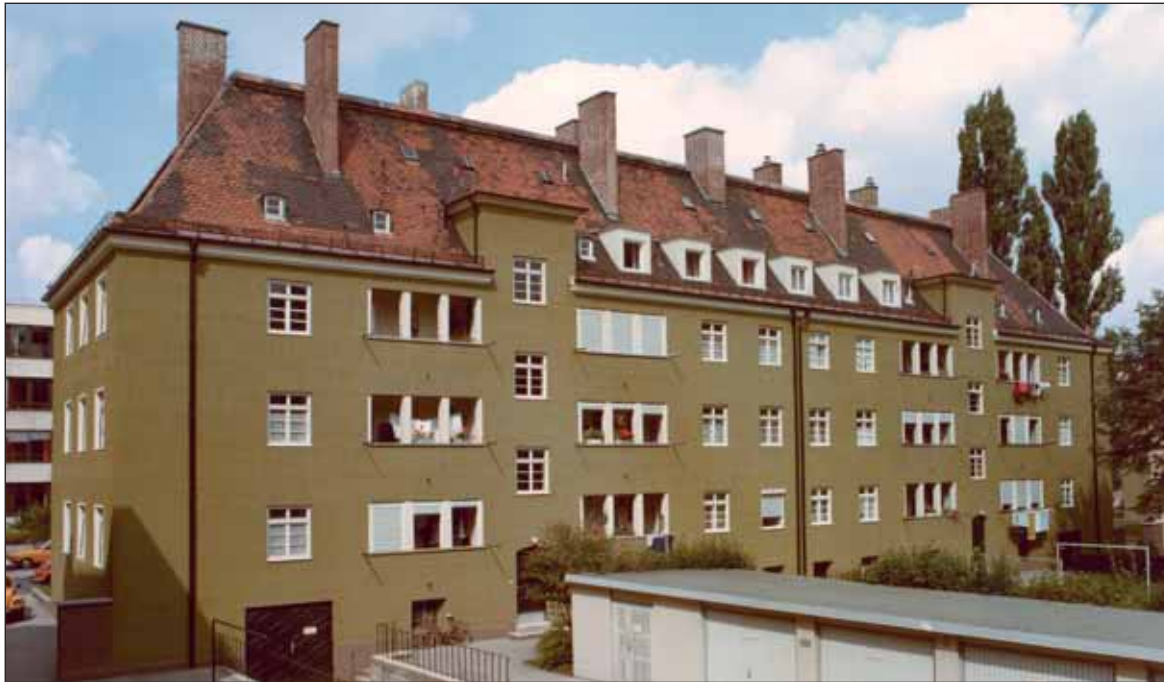
Hörselbergstraße vor der Renovierung