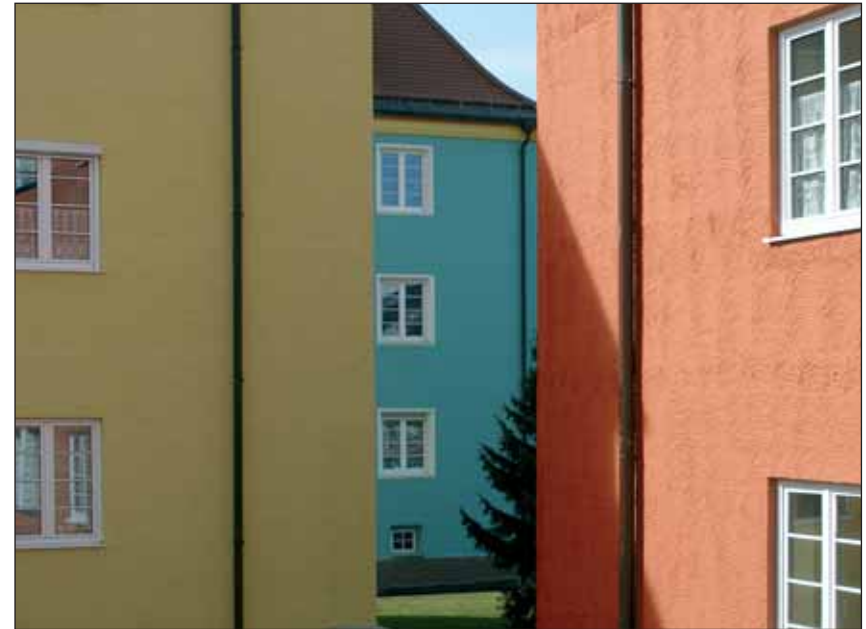
Blick von Hofseite nach Süd-West