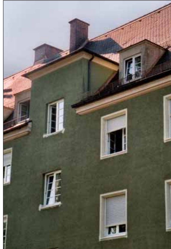
Hofansichten vor der Renovierung - Stuntzstraße