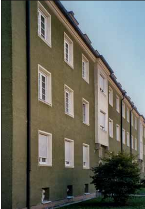
Hörselbergstraße vor der Renovierung